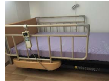
電動可動式ベッド